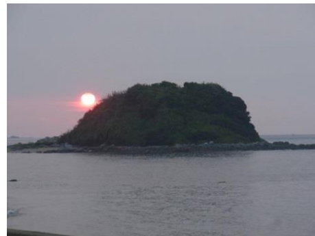
ちょうど沖津宮の辺りに日が沈んでいきます。